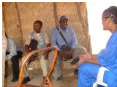
Visita ao campo, onde lancamos um obreiro do projeto Ekiblar