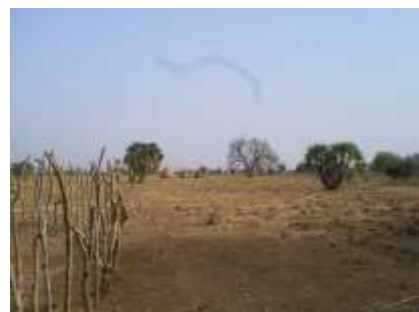
Caminho para Nirkooy