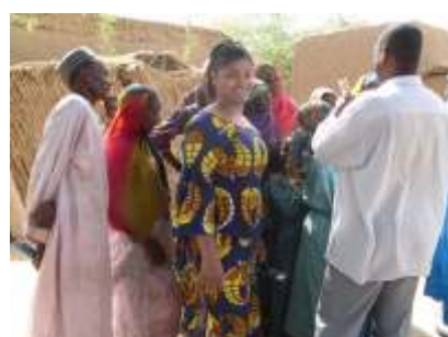
Vilarejo de DIFA