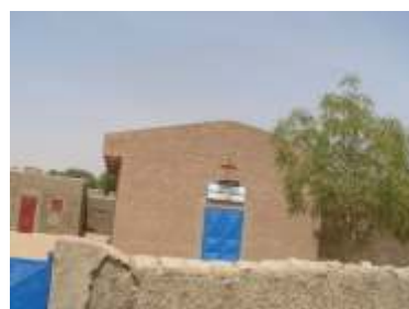
Única igreja em uma cidade de mais 10 mil habitantes