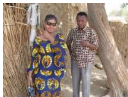
Vice presidente da Assembleia de Deus no Niger