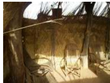
Igreja por dentro