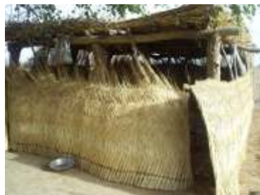
Igreja construída em Nirkooy